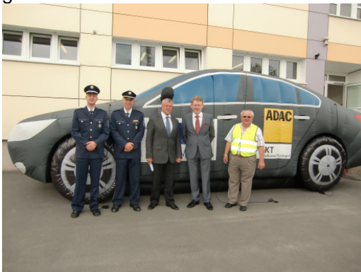
2.v.l. Minister Christian Carius TMBLV zeigte sich sehr beeindruckt von der „Größe“ des Autos

Zum Schulanfangsaktionstag am 26.08.2010 in Pößneck kam das Airdisplay zum ersten großen Einsatz